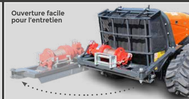
Ouverture facile pour l'entretien