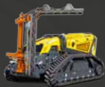
Lamier a disques