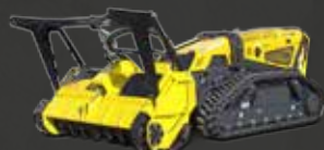
Broyeur forestier à dents fixes